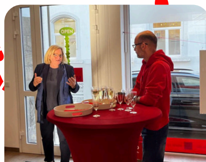
Neujahresempfang der SPD Schwelm