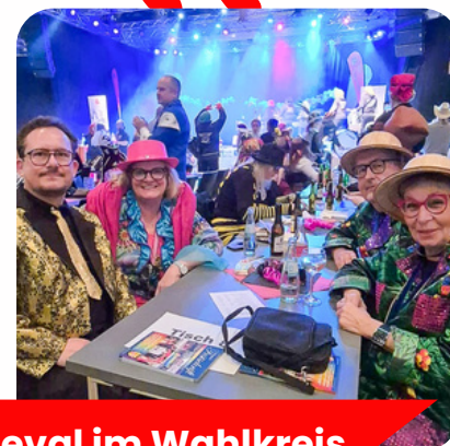
Karneval im Wahlkreis